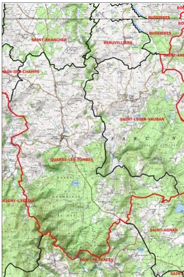
Localisation de la commune de Quarré-les-Tombes/IGN/Secteur d'étude élargi aux communes avoisinantes Données DREAL Bourgogne Franche Comté/ IGN SCAN 25

La commune est soumise à trois types d'aléas et/ou de risques : potentiel radon (catégorie 3), aléa retrait/gonflement des argiles et risque d'inondations par crue torrentielle de la Cure et du Cousin (ou Trinquelin). A ce titre, les plans de prévention du risque inondation (PPRI) de la Cure et du Trinquelin ont été arrêtés respectivement le 22 décembre 2012 et le 7 novembre 2011 par arrêté préfectoral et s'imposent au PLU.