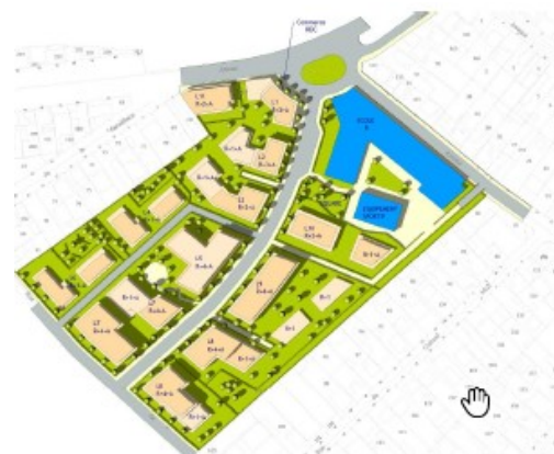
Fig 45. Plan masse du quartier Bienvenue