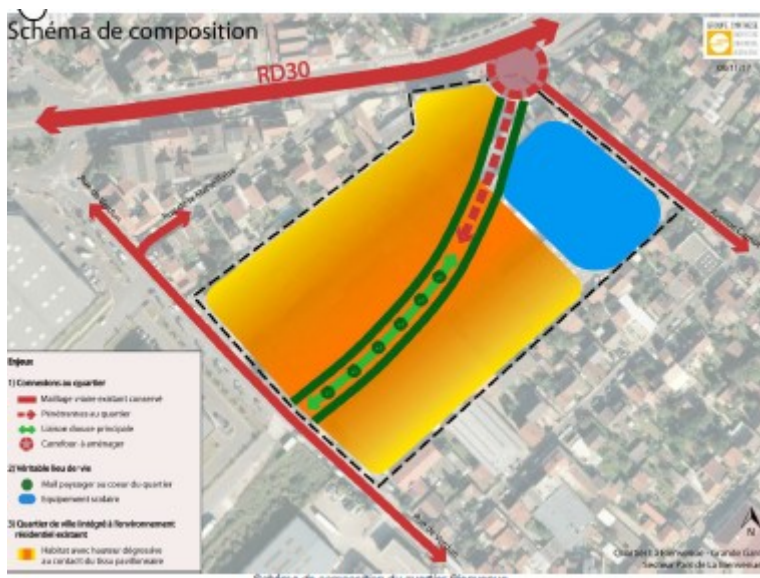
Fig 4. Schéma de composition du quartier Bienvenue