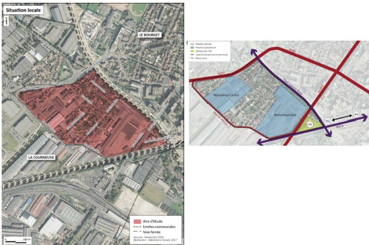
Fig 1. Localisation du site du projet.

Le quartier de la Gare sera en lien direct avec le futur pôle multimodal et constituera aussi une entrée de ville avec des aménagements comportant les objectifs suivants :