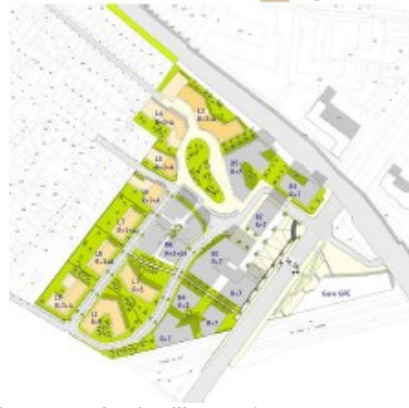
Fig 3. Les deux esquisses du quartier Gare.

Le plan de composition retenu de ce scénario intègre un square paysager particulièrement connecté aux voies résidentielles limitrophes (avenues Carnot et Pasteur).