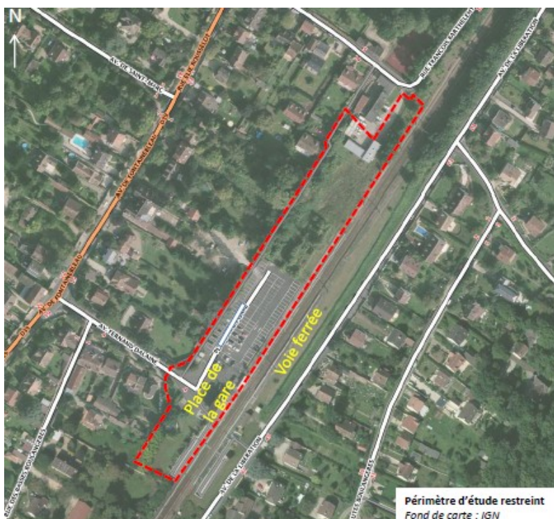
Illustration n° 5 : Plan de situation de l'OAP n°3 secteur de la gare - page 11 de la pièce "orientations d'aménagement et de programmation" du projet arrêté de PLU d'Héricy

L'OAP n°3 du secteur gare comprend la réalisation de 50 logements à proximité immédiate de la voie de chemin de fer 2 , classée voie bruyante de catégorie 1 par l'arrêté préfectoral n° 99 DAI 1CV 048 du 12 mars 1999, qui définit le classement acoustique des infrastructures de transport terrestre et impose une isolation phonique des nouvelles constructions dans les secteurs affectés par le bruit, à savoir une bande de 300 mètres de part et d'autre de la voie ferrée, dans le cas présent.