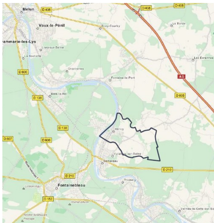
Illustration n°1 : plan de situation.

Selon le PADD, le projet de PLU a notamment pour objectif, à l'horizon 2030, de créer 146 logements et de permettre une croissance démographique de 0,5 % par an pour atteindre environ 2 700 habitants. Le rapport précise page 32 que pour atteindre cet objectif, la production de 255 logements est nécessaire. Il est également indiqué page 12 du rapport de présentation que 177 logements sont nécessaires pour maintenir la population actuelle, compte-tenu du phénomène de desserrement des ménages.