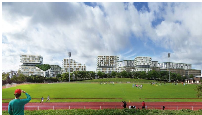
Figure 5: vue du projet depuis le parc des sports