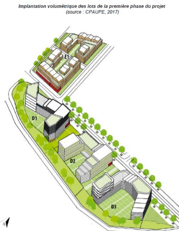
Figure 1: plans des lots E1, d1 et D3 du projet

Le programme de construction d'environ 300 000 m 2 de surface de plancher comprend :