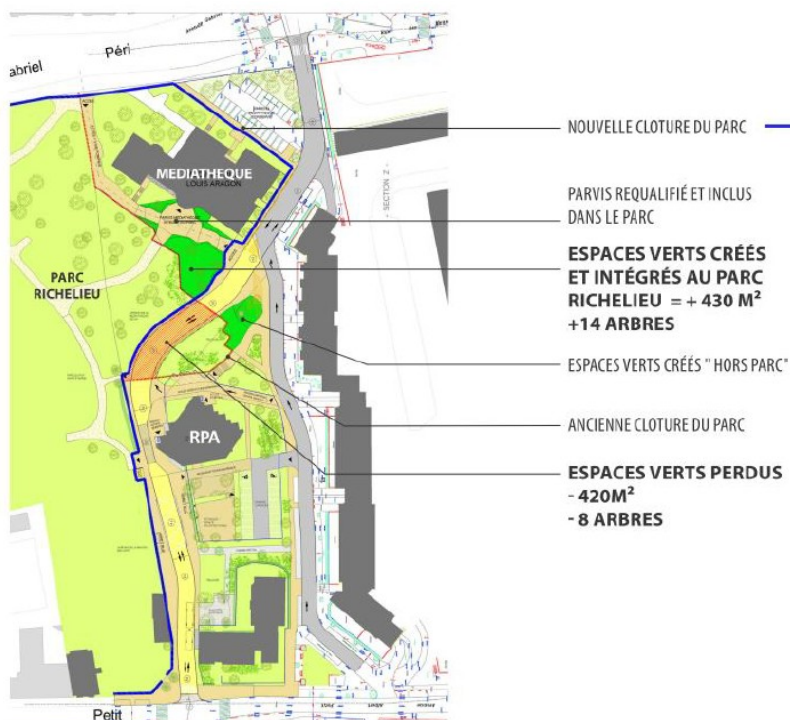
Figure 6: aménagement du parc Richelieu