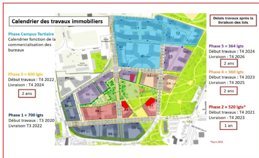
Figure 4: Calendrier des travaux immobiliers du projet (EI p. 506)