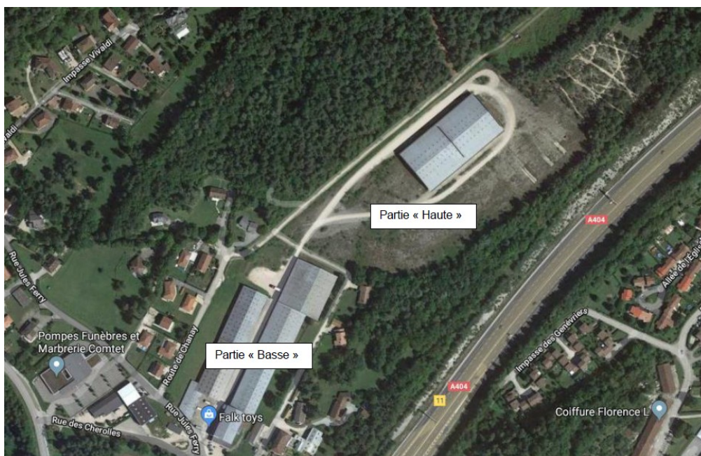
Figure 1 : État initial du site d'implantation du projet

L'usine sera implantée en zone « haute » du tènement, et sera constituée par un seul bâtiment d'environ 24 000 m 2 d'emprise au sol abritant les différents procédés mis en œuvre, ainsi que le stockage de matières premières et produits semis-finis (le stockage de produits finis étant externalisé).