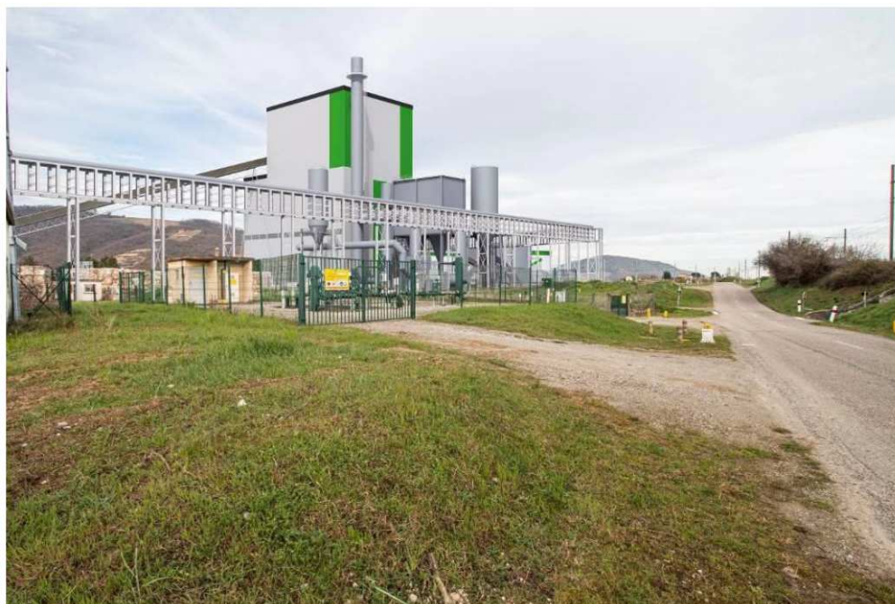
Insertion paysagère du projet d'extension au nord du site depuis la route départementale D257 longeant le site à l'Est