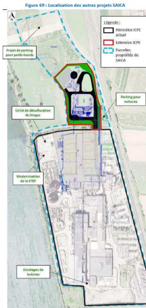
Localisation des autres projets de l'exploitant Extrait EI p.248

Il ressort également de l'étude du dossier que l'exploitant a d'autres projets d'extension concernant son site lesquels sont manifestement en lien avec la modernisation de l'outil de production et l'augmentation des quantités produites, avec notamment la réalisation d'un parking pour les poids lourds au nord de l'extension prévue pour la centrale, ou encore la réalisation d'un parking pour les voitures le long du site à l'Est 9 .