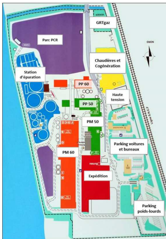
Organisation du site actuel

Le site produit actuellement 500 000 tonnes par an de papier pour cartons ondulés, issues à 100 % de papiers et cartons à recycler 1 qui sont stockés au préalable sur le parc PCR. Les refus fibreux (11000 t) générés dans le cadre de la préparation de la pâte à papier sont actuellement envoyés au compostage et les refus de pulpeur et les torons 2 . (30000 t) sont envoyés en centre d'enfouissement 3 .