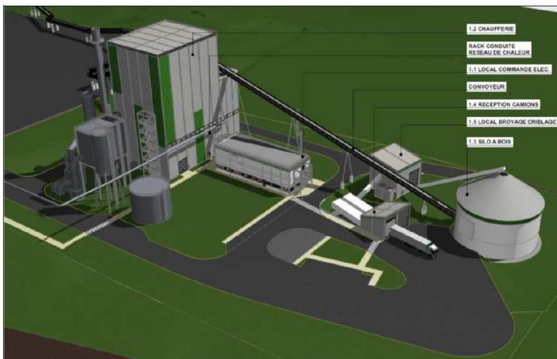
Illustration du projet envisagé sur l'extension au nord du site et de ses principales composantes

Enfin, la centrale comportera une unité de traitement et de contrôle des rejets atmosphériques, permettant notamment un filtrage et une réduction des oxydes d'azote (NOx) émis au niveau d'une cheminée d'une hauteur de 50 mètres.