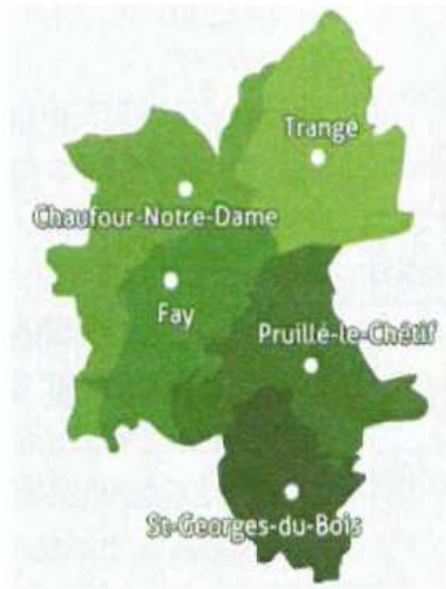
Figure 2 Situation de la Communauté de communes et carte du territoire intercommunal