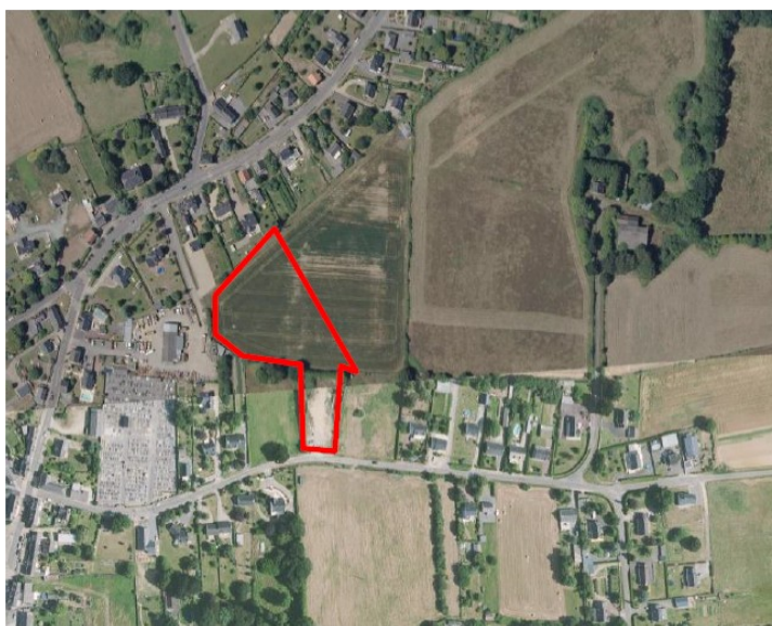
(Localisation du projet – extrait de la notice de présentation, page 8)

La présente mise en compatibilité porte sur l'ouverture à l'urbanisation de la zone 2AU et une partie de la zone Ab de la Faucillonais, pour un total d'1,2 ha environ. Le secteur d'implantation est actuellement couvert par l'emplacement réservé n°17, qui concernait la réalisation du nouveau cimetière.