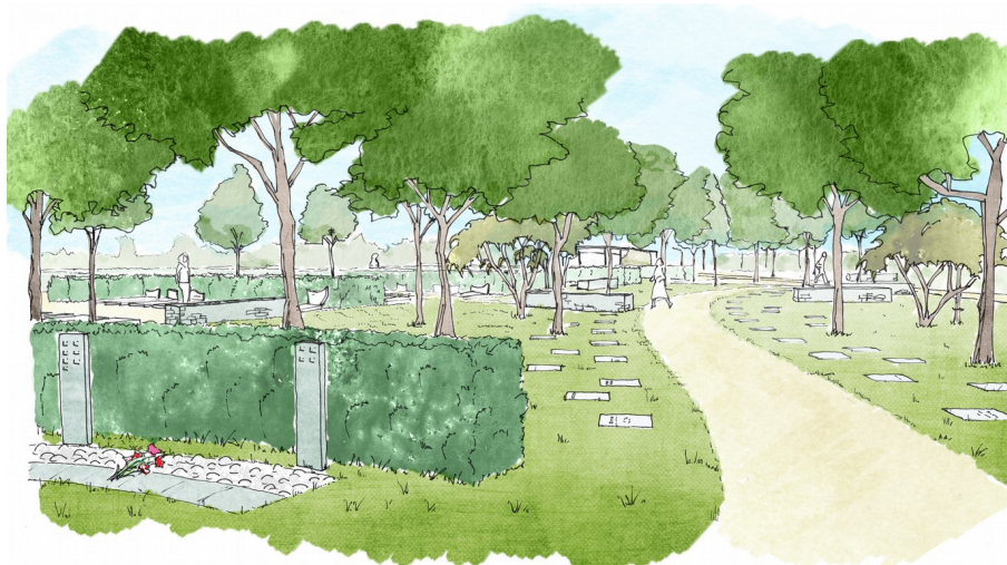
(Perspective du bosquet cinéraire : extrait de l'esquisse paysagère)

Le dossier intègre une esquisse paysagère permettant d'appréhender cet aménagement paysager en intégrant un plan de masse et une perspective aérienne depuis l'entrée du futur cimetière.