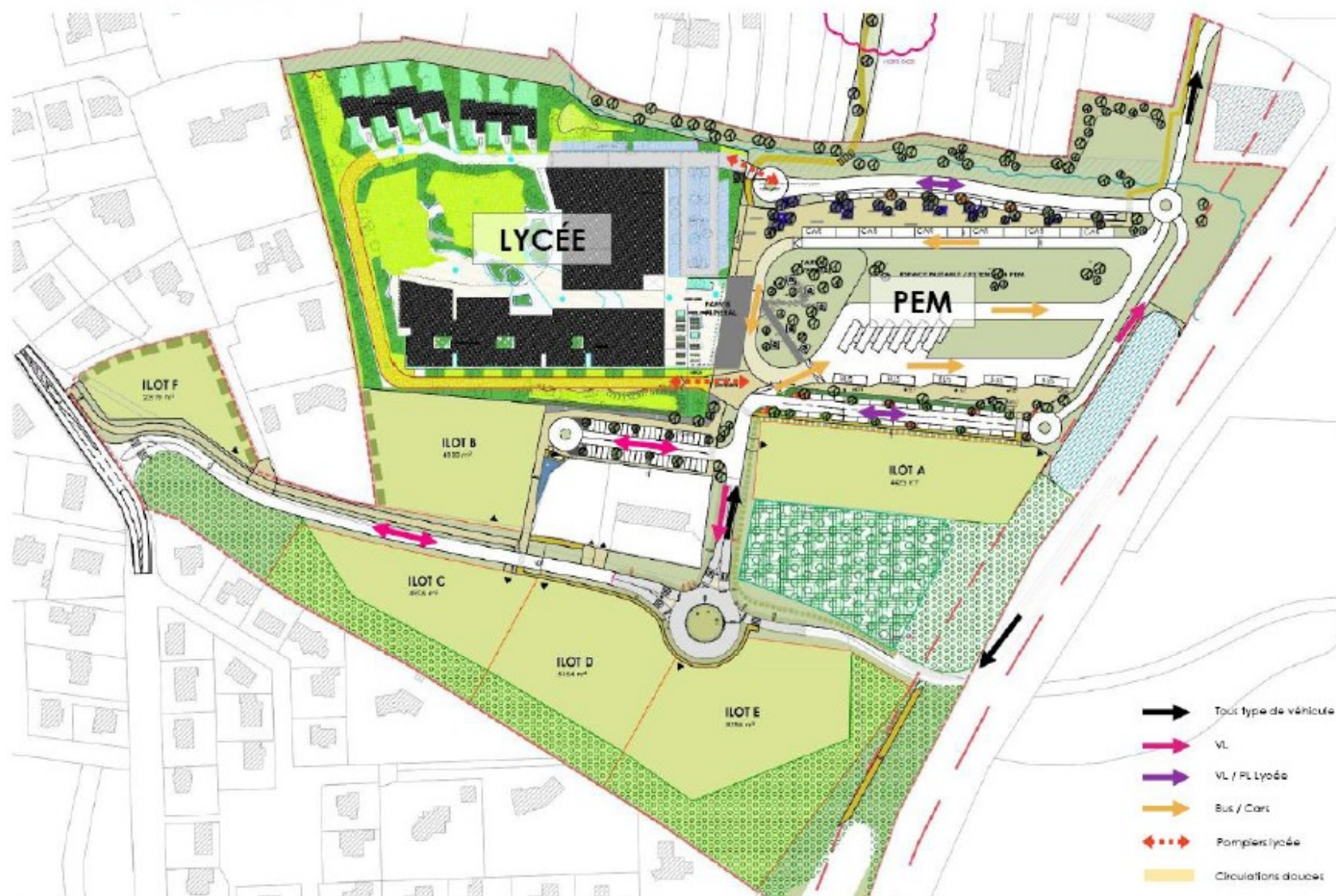
Illustration 2: Plan d'aménagement du site de Réhumpol (source : étude d'impact du réaménagement du secteur de Réhumpol)