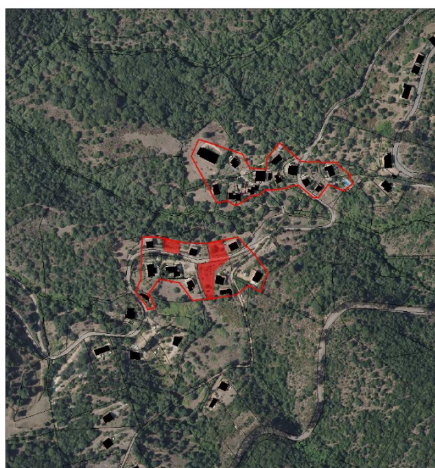
Surface résiduelle Vetriccia et Vignale

Illustration 1: Parcelles (en rouge) constituant le potentiel de densification de la commune de Partinello – extrait du rapport de présentation – partie I p.160