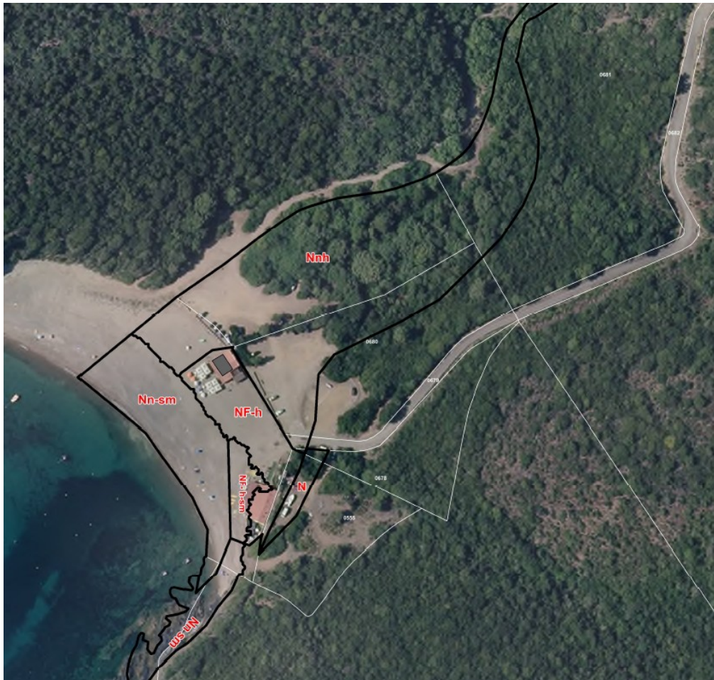
Illustration 3: zonages du PLU de Partinello au niveau de Caspiu – extrait du zonage du PLU de Partinello

La MRAe invite la commune à reconsidérer le règlement de la zone naturelle « N » du PLU de Partinello afin de mieux garantir la préservation de la qualité paysagère et environnementale du littoral en :