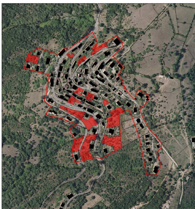
Surface résiduelle – village

Concernant la consommation des espaces naturels, agricoles et forestiers, le rapport de présentation s'attache dans un premier temps à recenser précisément les capacités de densification et de mutation du village (parcelles en rouge sur l'illustration 1 ci-dessous) de Partinello (1,3ha) et des deux hameaux de Vetriccia et Vignale (0,2ha). Il est ainsi recensé un potentiel de 1,5 ha de densification au sein des formes urbaines de la commune de Partinello pour une capacité d'environ 8 à 10 logements 8 . Ce potentiel de densification correspond aux besoins identifiés pour accueillir la progression démographique envisagée d'ici 2030 : en effet, le projet d'aménagement et de développement durable affiche une volonté d'accueillir entre 15 et 20 habitants supplémentaires soit un besoin compris entre 7 et 10 logements 9 .