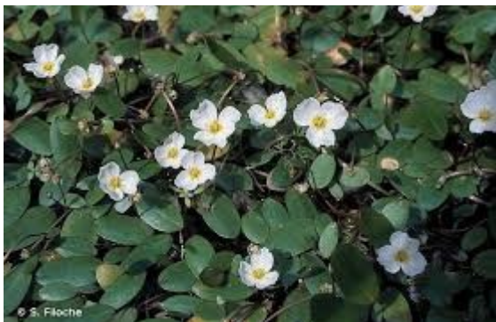
Flûteau nageant – Source : inpn.mnhn.fr

l'implantation de 2 constructions à vocation d'habitation. L'Ae attire l'attention de la commune sur la présence dans cette ZNIEFF d'espèces d'intérêt communautaire (Leucorrhine à gros thorax, Triton crêté et Flûteau nageant) qui risquent d'être impactées par les habitations de la zone UA. L'Autorité environnementale n'est pas convaincue par les conclusions de l'évaluation des incidences qui n'indique aucun impact des habitations sur ces espèces.