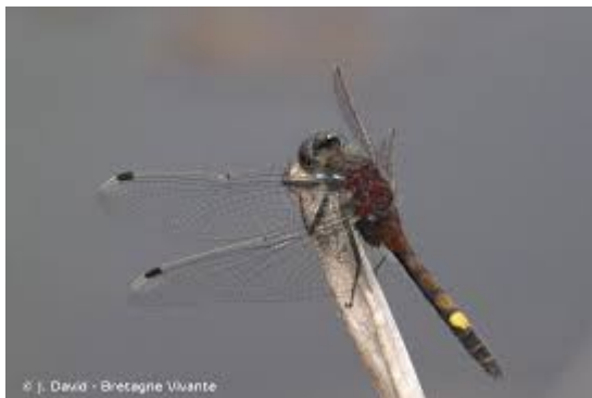
Leucorrhine à gros thorax

L'Autorité environnementale recommande de compléter le dossier par une étude des impacts de l'urbanisation sur la ZNIEFF « Bois des Roches à Festigny et à Leuvrigny » et de prendre des mesures pour protéger le site et les espèces selon la démarche ERC.