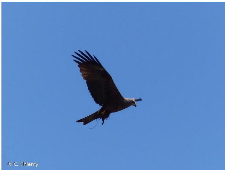
Milan noir ( Milvus migrans )

Il est prévu d'aménager 6 espaces refuges pour les reptiles et les petits mammifères avant le démarrage des travaux. Ces espaces composés de tas de végétaux ou de pierres ont pour objectif d'attirer la petite faune et ainsi de réduire le risque que des individus aillent sur l'emprise des travaux. Ils seront maintenus après les travaux. Les arbres à abattre qui sont susceptibles d'abriter des chauves-souris seront inspectés et, en cas de présence de chauves-souris, ils feront l'objet d'un protocole de coupe spécifique visant à éviter la destruction d'individus (colmatage des gîtes pendant que les chauves-souris sont parties chasser, les branches et troncs creux seront descendus avec précaution et laissés au sol 48 h pour permettre aux individus présents à l'intérieur de s'échapper). Les coupes d'arbres devront intervenir hors des périodes de reproduction et d'hivernage des oiseaux et des chauves-souris. Les pieds de Filipendule vulgaire seront balisés durant le chantier pour éviter leur destruction.