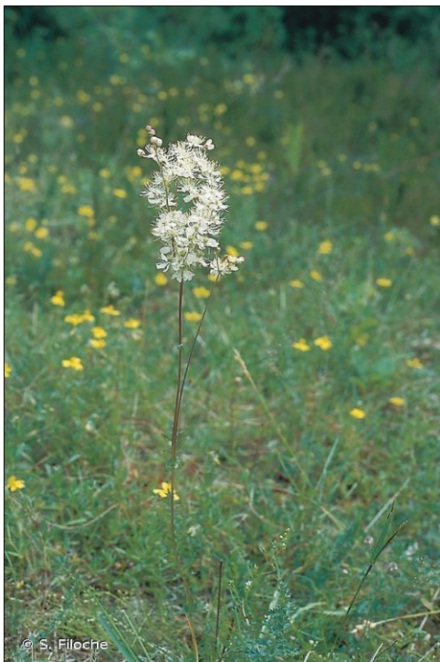
Filipendule vulgaire ( Filipendula vulgaris )

Concernant les chauves-souris, 6 espèces sont présentes dont une espèce d'enjeu fort (Noctule commune), 3 espèces d'enjeu moyen (Oreillard roux, Pipistrelle commune et Pipistrelle de Nathusius) et 2 espèces d'enjeu faible (Sérotine commune et Oreillard gris).