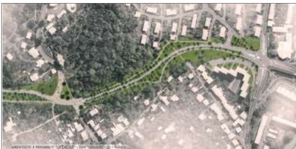
Tracé entre la rue Pasteur (à gauche) et l'avenue Saint-Michel (à droite)

Le projet est situé en bordure du site classé « Parc de l'Abiétinée et de la cure d'air Trianon ». D'après l'étude d'impact, la nouvelle voirie évite le parc de l'Abiétinée, un ancien arboretum du début du XXe siècle qui témoigne de l'âge d'or de l'horticulture lorraine et de l'art nouveau de l'école de Nancy. Malgré plusieurs décennies d'abandon, le parc conserve un patrimoine végétal unique, avec des spécimens rares à l'échelle nationale, voire internationale. Ce site ayant été classé en 2013, le tracé a été modifié depuis pour réduire l'impact sur le parc de l'Abiétinée. Le projet traverse également les périmètres de protection de 2 monuments historiques, la cure d'air Trianon et l'église Saint-Martin de Malzéville, sans covisibilité avec eux.