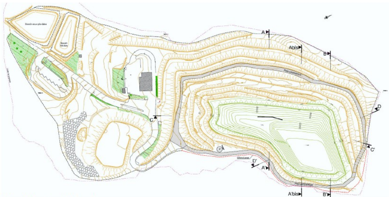
Vue de dessus de l'ensemble de l'ISDND avec ses bassins de lixiviats et d'eau pluviale

Les schémas ci-après permettent de se rendre des modifications projetées sur le casier actuellement en exploitation