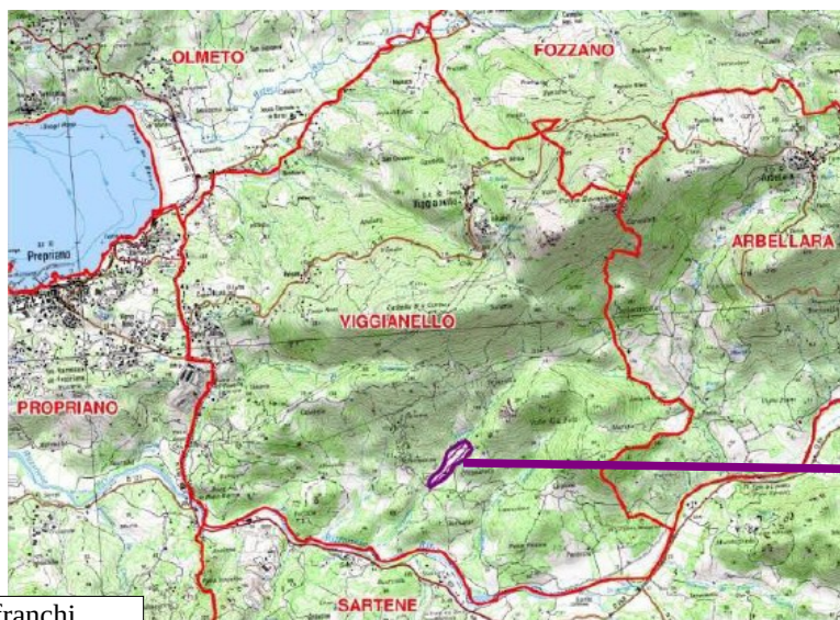
Situation géographique de l'ISDND

Les habitations occupées les plus proches se trouvent à 900 m du casier de stockage. Le projet ne concerne aucune emprise nouvelle.