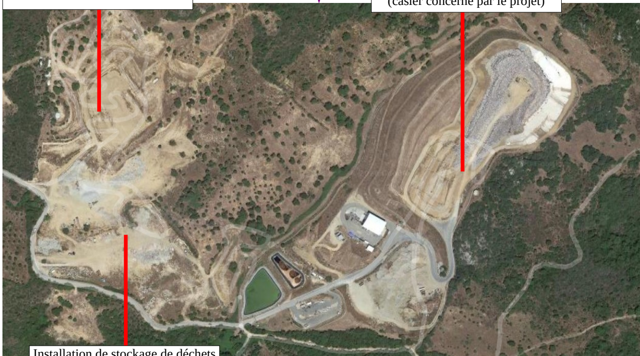
Installation de stockage de déchets inertes de la société Lanfranchi SAS