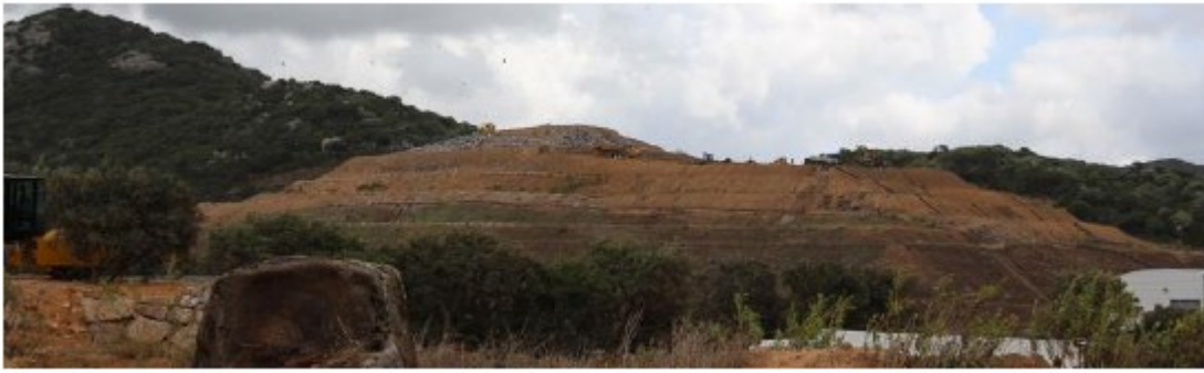
Vue du casier concerné avec un début de reprise de la végétation en partie aval