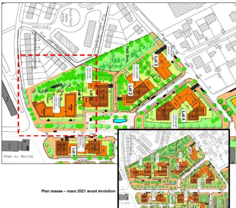
Figure 2: Évolution du projet sur le lot 1.