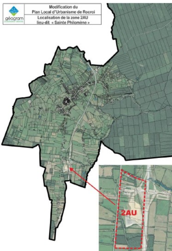
Figure 2: extrait du dossier

La commune souhaite déroger aux reculs générés par l'autoroute A304 et la RD8051 dans la zone à urbaniser « Sainte-Philomène » en passant à 15 mètres au lieu des 100 ou 75 m imposées par la réglementation. Cette zone, située au sud à environ 2,5 km de l'entrée de la commune de Rocroi, est destinée à accueillir des activités d'hébergements hôteliers, bureaux, commerces, artisanats, entrepôts et industries.