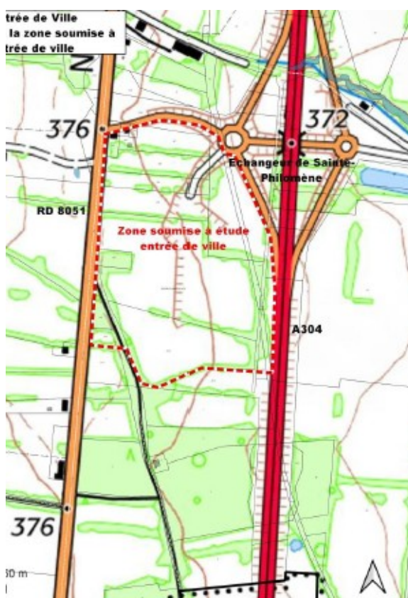
Figure 3: extrait du dossier

Une procédure de modification du PLU a été menée notamment pour ouvrir à l'urbanisation la zone « Sainte-Philomène » (2AU en 1AU) et pour laquelle l'Ae a émis un avis le 1 er avril 2021 23 .