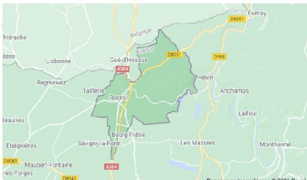
Figure 1:

Sont recensés sur la commune de Rocroi :