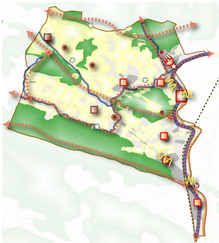
Extrait du zonage du PLU de Crampagna (Notice explicative p. 12)