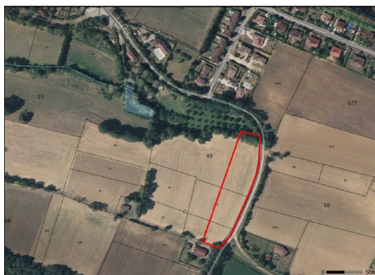
Figure 8 : Secteur pigeonnier, source : Géoportail

Alors que les différents secteurs d'urbanisation future sont en continuité avec l'urbanisation actuelle, le secteur « Le Pigeonnier », d'une surface de 0,6 ha, apparaît en déconnexion, situé en contrebas du bourg et séparé par un boisement que la commune entend protéger. Aucun argument ne vient appuyer ce choix qui induira notamment des impacts potentiels négatifs en termes de mobilité douce, de sécurité routière, de paysage, etc.