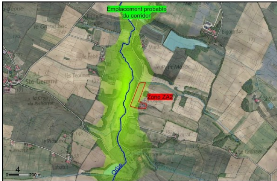
Figure 11 : Secteur d'En Capin, Réalisation : COMET

La commune indique protéger l'espace boisé situé entre les secteurs « Les Moulins » et « Le Pigeonnier » à l'aide d'un sous-secteur « ZNp ». Or, comme indiqué précédemment, le code de l'urbanisme ne permet pas à une carte communale d'identifier de tels sous-zonages. La MRAe rappelle que les éléments qui présentent un intérêt paysager et écologique peuvent faire l'objet d'une protection au titre de l'article L.111-22 du code de l'urbanisme selon lequel « (...) le conseil municipal peut, par délibération prise après une enquête publique (...), identifier et localiser un ou plusieurs éléments présentant un intérêt patrimonial, paysager ou écologique et définir, si nécessaire, les prescriptions de nature à assurer leur protection ». Le rapport de présentation n'étant pas opposable aux constructions, travaux et projets d'aménagements, la MRAe encourage la commune à utiliser la possibilité de prendre une délibération en vue de protéger les éléments identifiés, tant du point de vue de la biodiversité que du patrimoine, lorsque la carte communale, qui a une capacité très limitée en la matière, ne peut le faire.