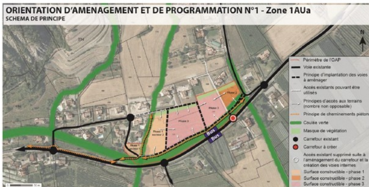
Figure 3: OAP