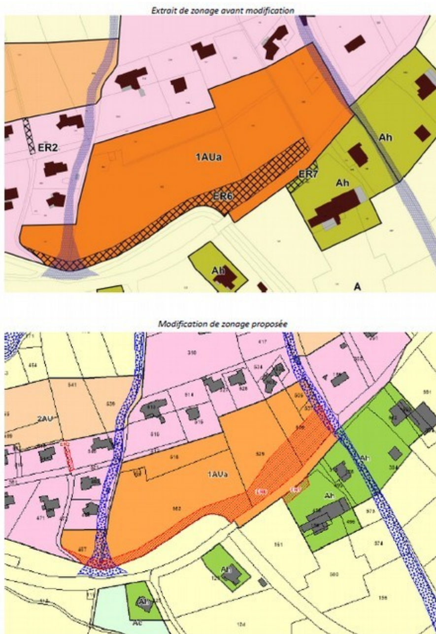
Figure 2: Emplacement réservé n°6 avant/après