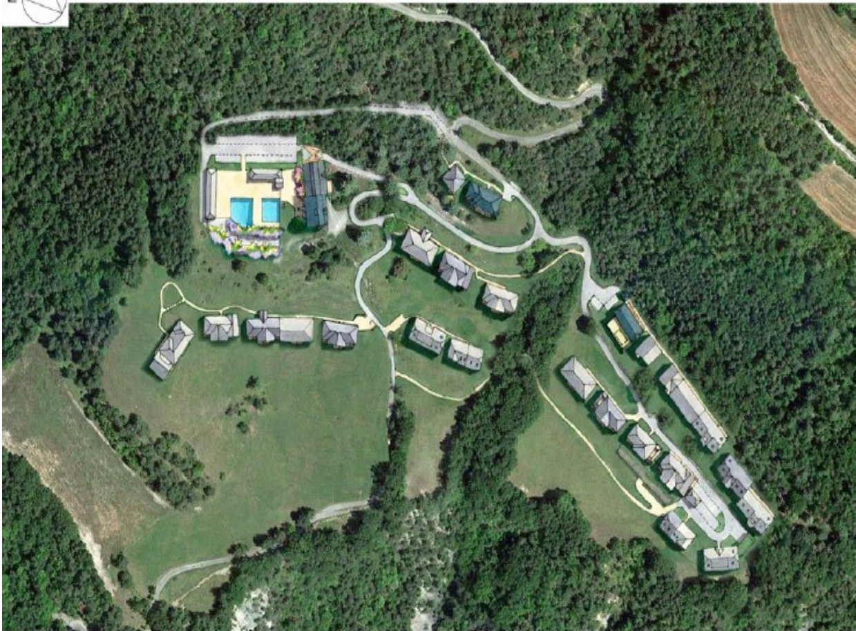
Figure 2 : Plan de masse du projet d'UTN