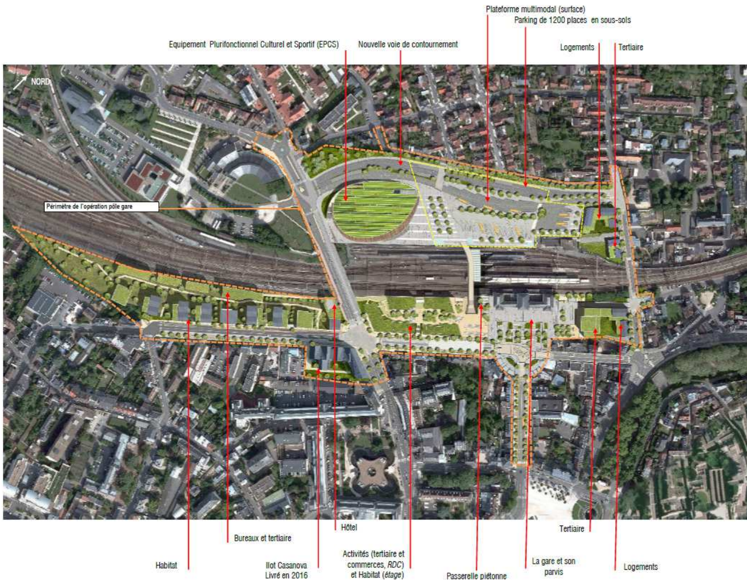
Illustration : Insertion du projet « Pôle gare »

Cependant le projet comprend également un aménagement du parvis de la gare, la réalisation d'une passerelle de liaison entre l'EPCS, la plateforme multimodale et le parvis de la gare SNCF. Il est également prévu une importante adaptation des déplacements et des plans de circulation autour de la gare par le biais d'une requalification de plus de 3 ha de voirie et d'espaces publics pour favoriser selon le dossier les transports en commun et les déplacements actifs par la création de pistes cyclables et l'élargissement des trottoirs.