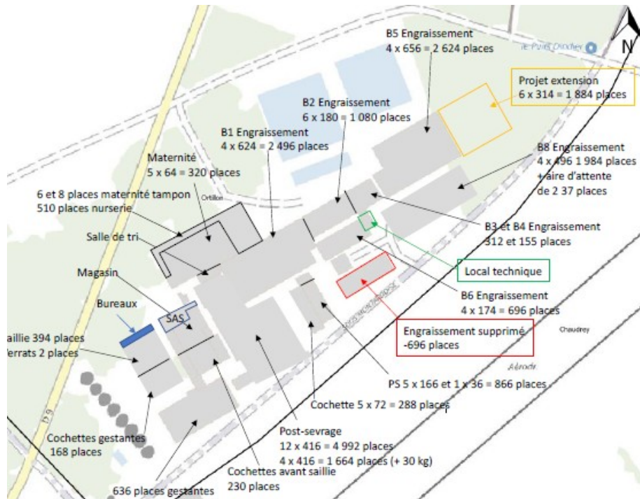
Figure 1 : réaménagement du site de Montardoise

Le plan d'épandage sera également modifié avec 1 070 ha de nouvelles parcelles 11 qui s'ajoutent aux 1 430 ha de parcelles déjà présentes pour atteindre une capacité d'épandage totale de 2 500 ha. Le volume de lisier épandu sera de 51 100 m 3 /an. Les nouvelles parcelles, mitoyennes de celles déjà incluses dans ce plan d'épandage, sont situées dans un rayon maximum de 4 km autour des sites et sont destinées à y cultiver colza, betterave, blé et orge de printemps.