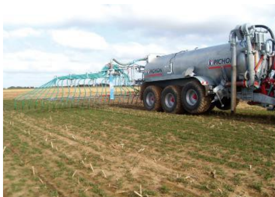
Rampe à pendillards

Le dossier indique que les charges en azote et en phosphore après projet seront, en valeur fertilisante, de 194 tonnes d'azote et 145 tonnes de phosphore. Le dossier précédent n'indiquait à aucun moment la valeur des charges moyennes par ha avant projet, ni celles après projet. Le nouveau dossier indique que la pression azotée après projet sera diminuée par rapport à la pression azotée avant projet mais sans justifier cette affirmation par des chiffres. L'impact du projet d'agrandissement de l'exploitation sur la ressource en eau ne peut donc toujours pas être estimé.