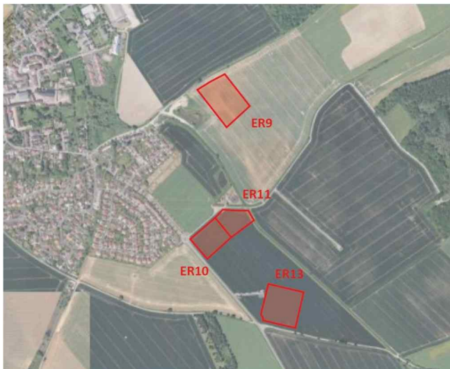
Figure 2:

Selon le rapport de présentation, le projet de révision dite allégée n° 3 du PLU est compatible avec les grandes orientations d'urbanisme du schéma directeur de la région Île-de-France (SDRIF) de 2013 et avec celles du schéma de cohérence territoriale (SCoT) de Roissy Pays de France de 2019.