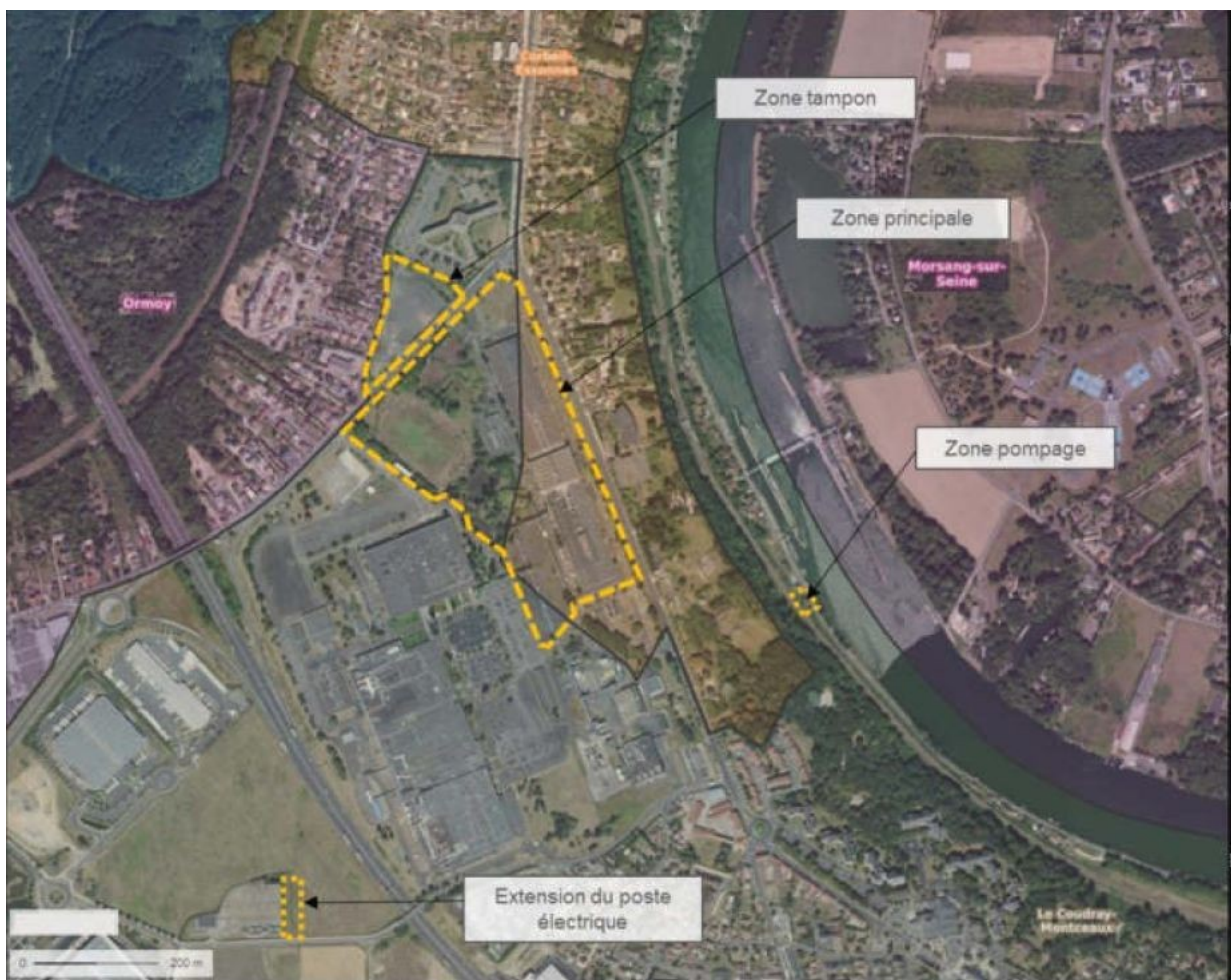
Figure 2: Foncier concerné par le projet