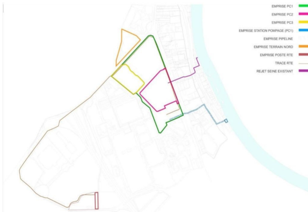
Figure 5: Représentation des emprises par phase du projet