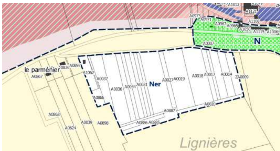
Extrait du zonage après modification

Avis délibéré de la MRAe Centre-Val de Loire n°2022-3731/A en date du 7 octobre 2022