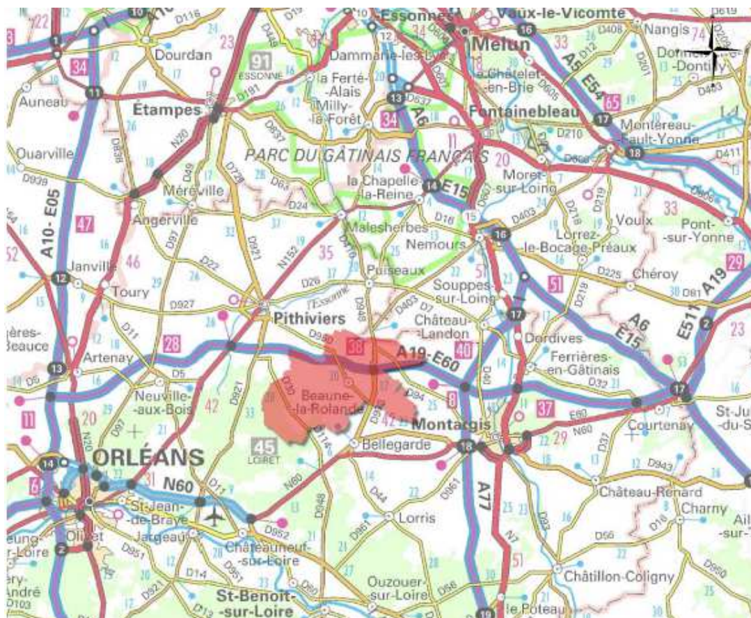
Localisation du territoire du Beaunois

Issue de la fusion en 2017 de la communauté de communes du Beaunois et de la communauté de communes des Terres Puisseautines étendue à la commune nouvelle « le Malesherbois », la communauté de communes Pithiverais Gâtinais forme une entité de 32 communes et comptait 25 939 habitants en 2019 (source Insee).