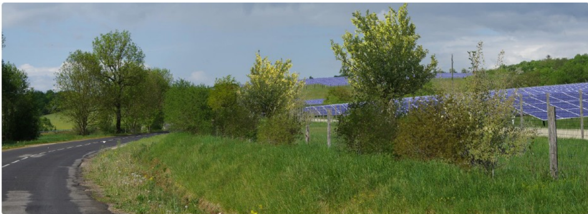
Figure 2: vue avec simulation de la centrale et des mesures d'accompagnement depuis la D127 en direction du nord (source dossier)

L'Ae recommande à nouveau de rechercher un site alternatif d'implantation du projet et à défaut de proposer des mesures complémentaires pour réduire l'impact du projet sur le paysage.