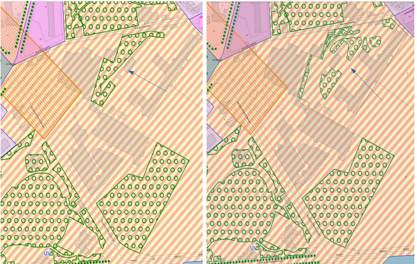
Réaménagement de l'EBC présent sur le site des Crayères avant (image à gauche) et après (image à droite) la révision allégée du PLU (voir flèche) – Source : dossier du pétitionnaire.