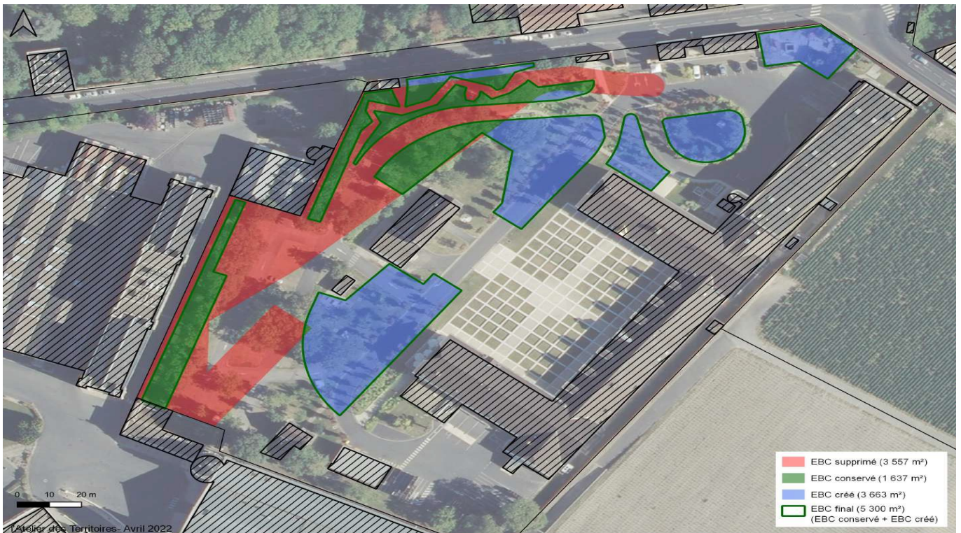
Évolution de la configuration de l'EBC sur le site des Crayères