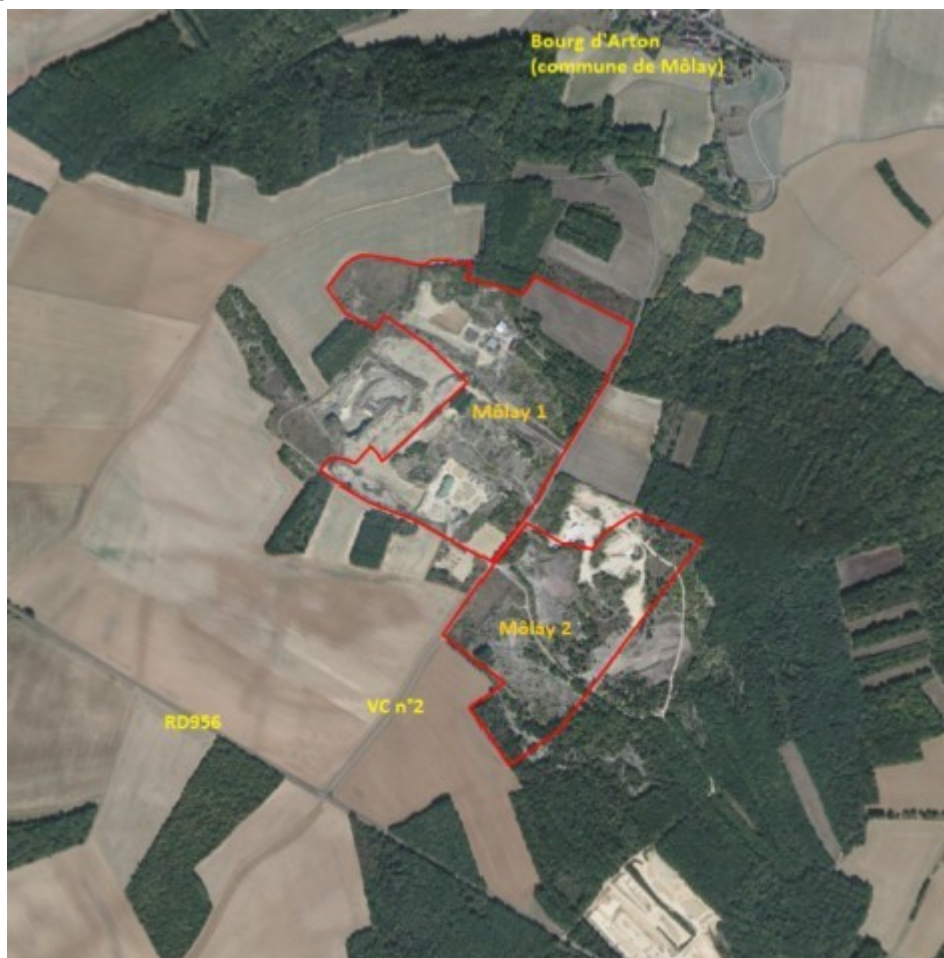
Photographie aérienne de la zone d'implantation potentielle (cf. p.41 de l'étude d'impact)

Le projet se situe sur le rebord d'un plateau légèrement ondulé entaillé par la vallée du Serein à 1,1 km au nord. Le site, anciennement exploité comme carrière de calcaire, est constitué, d'une part, de terrains remis en état et occupés par des friches de recolonisation (pelouses, fruticées, jeunes bois), et, d'autre part, par des zones non réhabilitées occupées par des remblais, d'anciens bâtiments d'exploitation ou utilisées pour diverses activités (plateforme de transit de produits minéraux, stockage de déchets inertes). Il est bordé par une mosaïque de cultures céréalières (principalement à l'ouest) et de boisements feuillus (principalement à l'est). Des zones de carrière toujours en exploitation délimitent le projet sur sa partie est. L'aire d'étude ne comporte aucun cours d'eau, ni zone humide et se situe en dehors de la zone inondable du PPRI 7 du Serein. Les habitations les plus proches se situent en contrebas du plateau au niveau du bourg d'Arton à environ 500 m au nord.