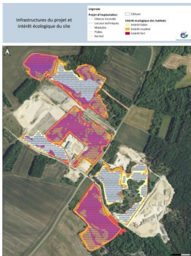
Hiérarchisation des enjeux écologiques dans la ZIP et superposition avec le projet (p.90 et p150 de l'étude d'impact)