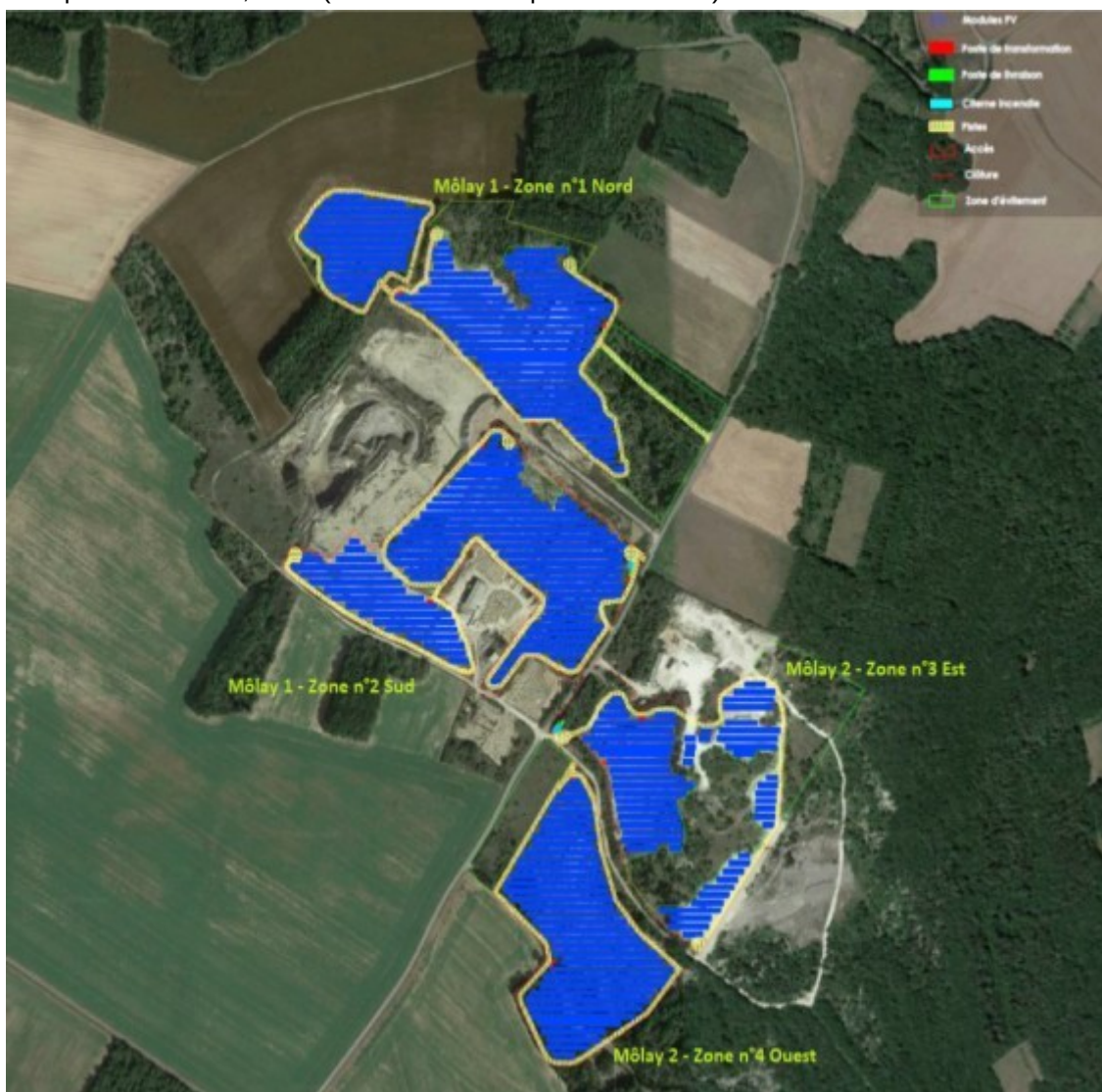
Plan d'implantation du projet (cf. p.24 de l'étude d'impact)

Le projet s'étend sur 5 emprises clôturées d'un total de 26 ha, réparties en 4 zones dans le dossier : « Môlay 1 – zone n°1 nord » (composée de 2 parties clôturées), « Môlay 1 – zone n°2 sud », « Môlay 2 – zone n°3 est » et « Môlay 2 – zone n°4 ouest ». Une promesse de bail ou de vente a été signée avec les propriétaires privés des parcelles cadastrales concernées. La surface au sol couverte par les panneaux photovoltaïques sera de 10,83 ha (soit 41 % des emprises clôturées).