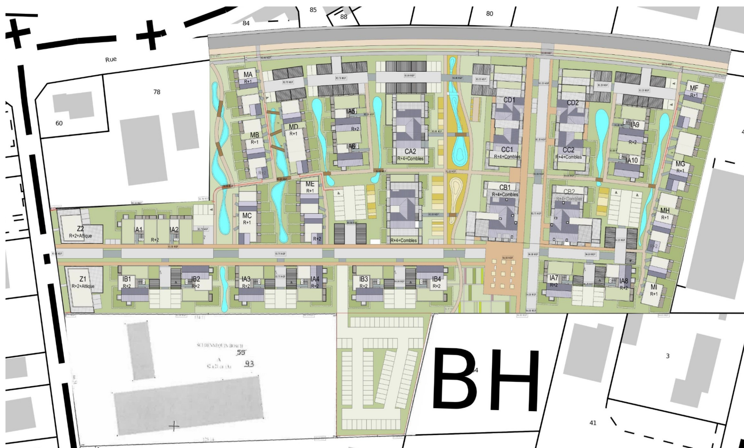
Plan de masse du projet

L'opération permettra d'accueillir une population de 1000 habitants. Elle prévoit également la construction de deux bâtiments de bureaux en bordure de la rue Marcet, la création de deux voiries internes (nord/sud et est/ouest) et l'aménagement de 485 places de stationnement automobile dont 70 % intégrées aux bâtiments et 30 % en aérien.