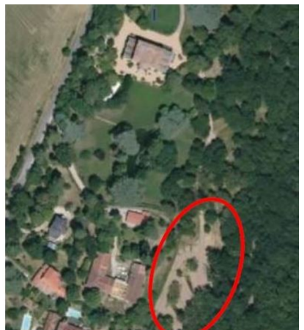
Localisation du projet au regard du château