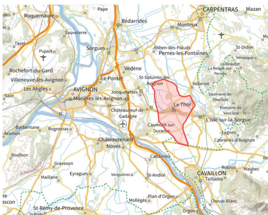
Figure 1 : Localisation de la commune – Source : BAse Territoriale Régionale AMénagement Environnement Provence Alpes Côte d'Azur https://batrame-paca.fr/

La commune du Thor, située dans le département de Vaucluse (84), comptait en 2020 une population de 8 883 habitants, sur une superficie de 35,53 km 2 . La commune, intégrée au SCoT du bassin de vie de Cavailhon, Coustellet, Isle-sur-la-Sorgue et comprise dans le périmètre de la Communauté de communes du Pays des Sorgues et des Monts de Vaucluse, est située à environ 14 kilomètres à l'est d'Avignon, dans la plaine du Comtat Venaissin (cf. figure 1). Le territoire communal est composé d'une zone urbaine, située le long du cours d'eau la Sorgue, autour de laquelle se développent de vastes espaces agricoles composés en particulier de cultures intensives maraîchères et de vergers.