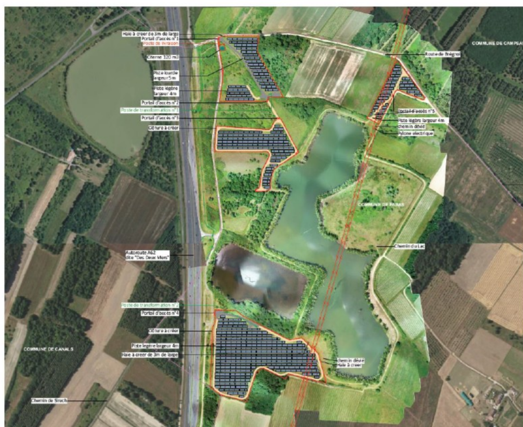
Figure 2 : plan de masse du projet