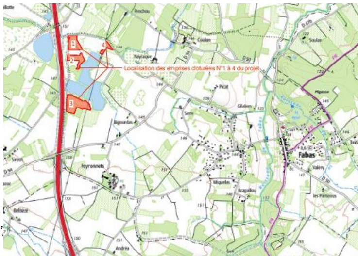
Figure 1 : localisation du projet