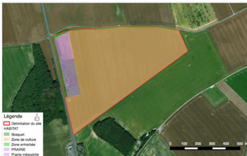
Figure 6 : Localisation des habitats écologiques présents sur l'emprise du projet

Quatre habitats sont recensés et cartographiés page 21 de l'étude écologique : prairie mésophile 6 à tendance humide, bosquet (arbres assez jeunes de moins de 30 ans selon l'étude page 22), talus enherbés et zones en friche de type annuelle nitrophile 7 et zone de grande culture. Aucun habitat naturel protégé n'est recensé.