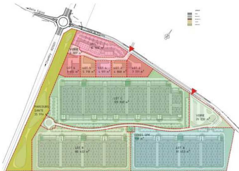
Projet d'aménagement du PARC du Pays de THELLE

Projet d'aménagement du Parc du Pays de Thelle