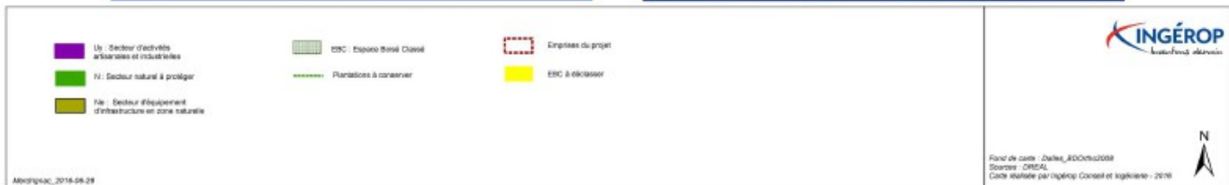
Extrait de l'évaluation environnementale de la mise en compatibilité du PLU de Trémorol