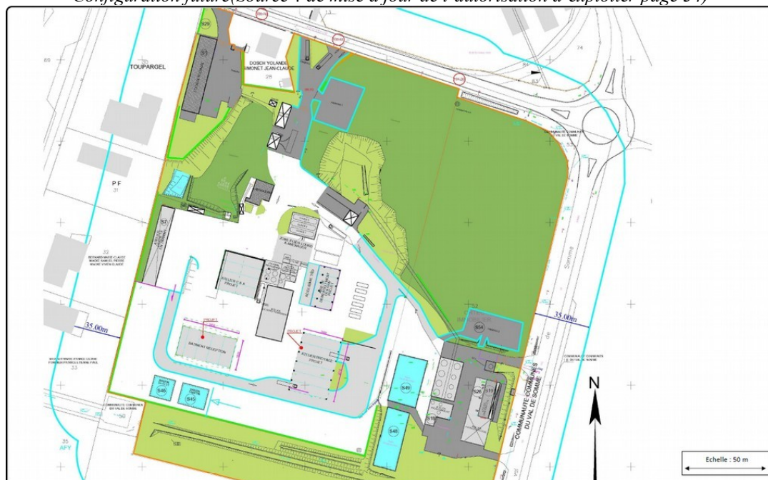
Configuration future