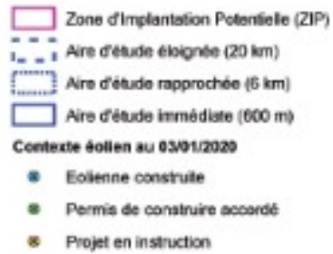
Carte d'implantation des parcs éoliens autour du projet (expertise paysagère et touristique partie 1 page 14)