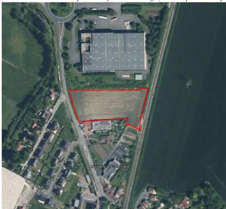
extrait cartographique identifiant le site concerné par le reclassement