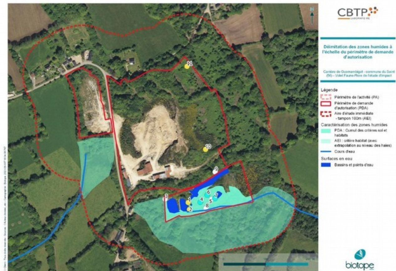
Zones humides définies par l'analyse des sols et le critère végétation / flore

Une analyse des effets accidentels potentiels a été menée, incluant les effets sur la population piscicole. Cette analyse ne conduit pas à la mise en œuvre de mesures supplémentaires, comme la possibilité de confiner des eaux éventuellement polluées, en raison du risque très faible que cela se produise, et de l'absence de canalisation entre les bassins de décantation et la rivière sud (écoulements par ruissellement ou infiltration).