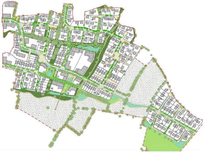
Figure 3: Principes d'aménagements du projet