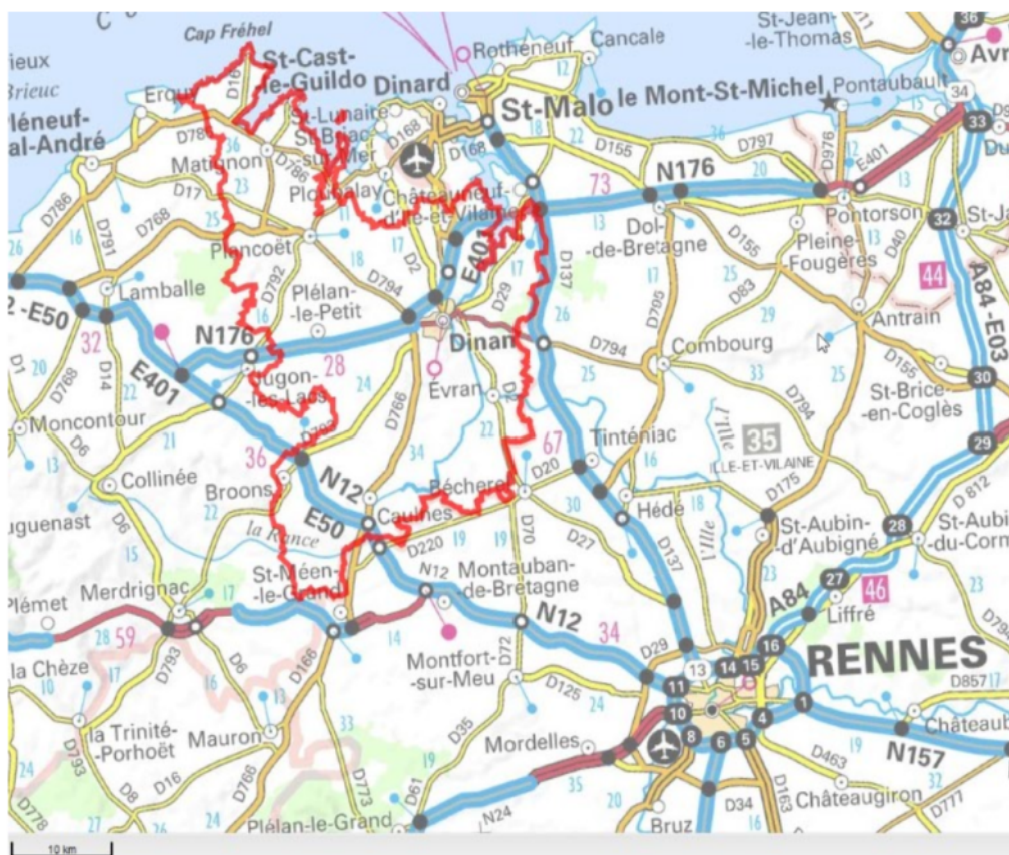
Localisation de Dinan agglomération

Dinan Agglomération est un établissement public de coopération intercommunale (EPCI) de l'est des Côtes-d'Armor. L'EPCI est composé de 64 communes et compte 98 270 habitants (Insee 2019). Son territoire comporte une façade maritime au nord, trois principaux bassins d'emplois (Dinan à l'est, Broons au sud, Plancoët au nord ouest), et un ensemble de communes rurales au sud.