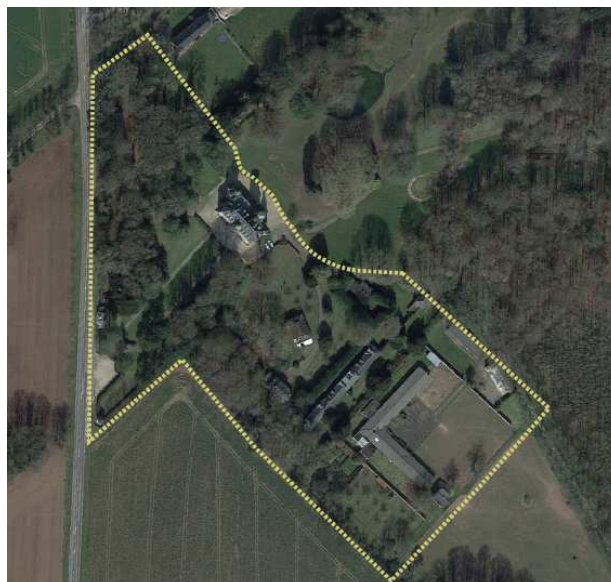
Localisation et zone de projet