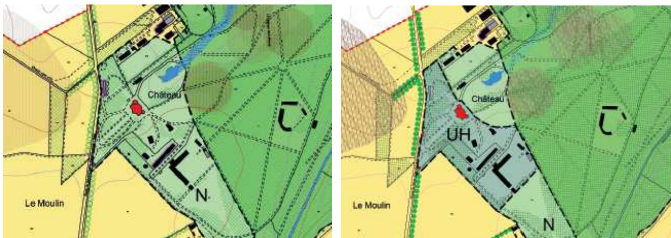
Plan de zonage avant et après la mise en compatibilité