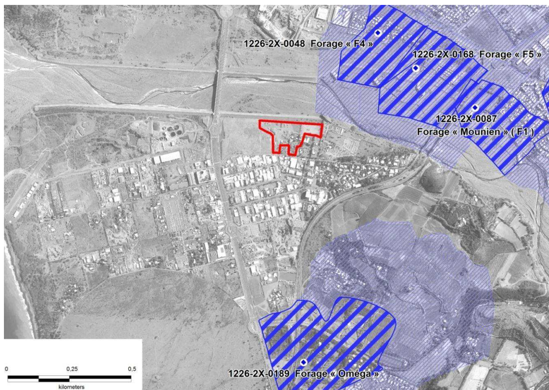
Localisation des forages et captages pour l'alimentation en eau potable à proximité des installations de VALORUN

Le site n'est pas concerné par une ressource stratégique ou une aire d'alimentation des captages [eau destinée à l'alimentation en eau potable (AEP) et à l'alimentation du réseau d'irrigation agricole]. Les forages pour l'alimentation en eau potable les plus proches des installations sont situés en amont sur la commune du Port à 500 m au nord-est et 650 m à l'est du site et en latéral éloigné sur la commune de Saint-Paul à 850 m plus au sud.