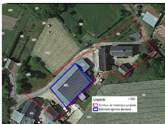
Photographie aérienne du secteur concerné issue du rapport de présentation

La collectivité souhaite réviser le plan local d'urbanisme de Sauveterre de Rouergue pour permettre le changement de destination et la valorisation d'anciens bâtiments agricoles.