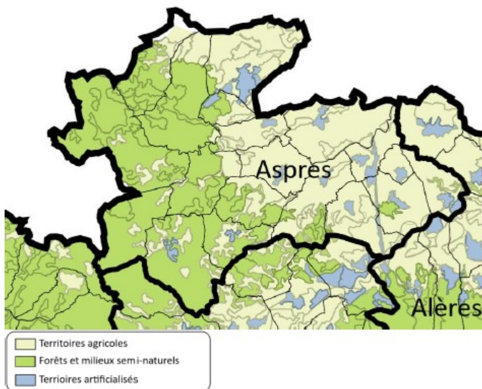
Figure 2 : occupation du sol de la communauté de communes (source : état initial de l'environnement du PCAET de la CCA– page 18)