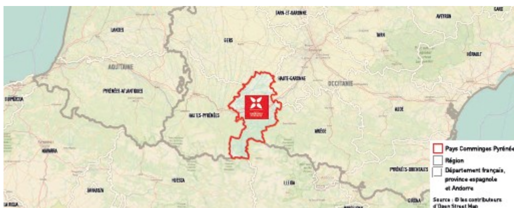
Carte de situation du territoire (tiré du rapport de présentation)

Le territoire du SCoT du Pays Comminges Pyrénées, dans le département de la Haute-Garonne, couvre 2140 km 2 et regroupe 235 communes, actuellement réparties en trois communautés de communes. Il comptait 77 468 habitants en 2015.