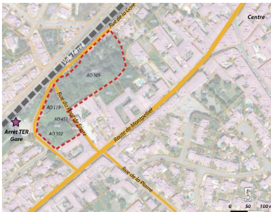
Illustration 2: Situation du secteur concerné par la révision allégée n°1 du PLU

Le secteur concerné par la révision allégée n°1 du PLU, d'une superficie de 0,97 ha, est situé au cœur de l'enveloppe urbaine du centre-bourg de Milhaud, au sein de la zone urbaine UC du PLU actuellement en vigueur.