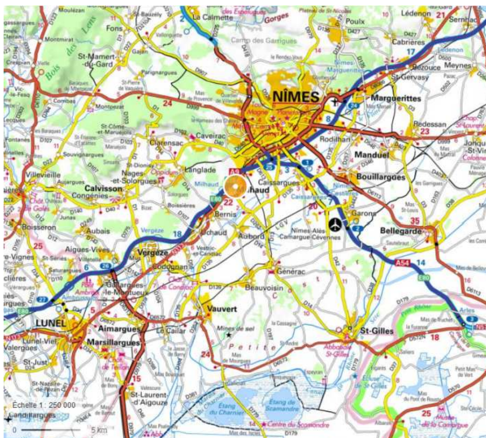
Illustration 1: Carte de localisation de la commune de Milhaud (Source : Géoportail)

La commune de Milhaud (5 717 habitants – INSEE 2018), bordée au nord par les garrigues et au sud par la plaine agricole de la Vistrinque, se trouve au sud-est de Nîmes de laquelle elle est limitrophe. Elle est traversée par la route nationale RN 113 qui relie Nîmes à Montpellier. Elle fait partie de la communauté d'agglomération de Nîmes Métropole (257 987 habitants – INSEE 2018), et est concernée par le schéma de cohérence territoriale (SCoT) Sud Gard approuvé le 10 décembre 2019.