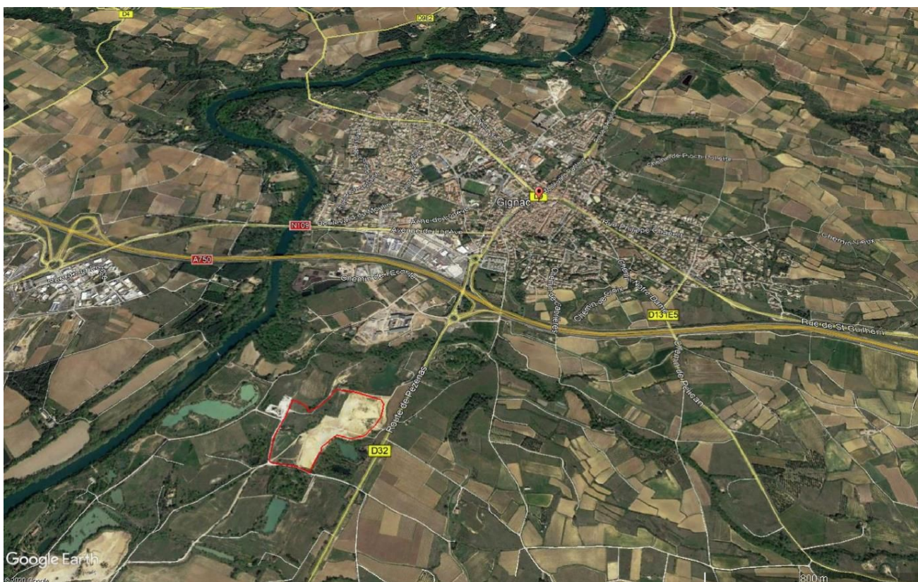
Figure 2: Localisation du projet (extrait rapport environnemental p.12)

À noter que le projet de centre de formation du SDIS a fait l'objet d'une décision de non soumission à étude d'impact en date du 15 décembre 2020 2 par l'autorité en charge des examens au cas par cas (préfet de région). Le SDIS avait mis en avant un ensemble de mesures d'évitement et de réduction afin de limiter les incidences négatives du projet sur l'environnement.