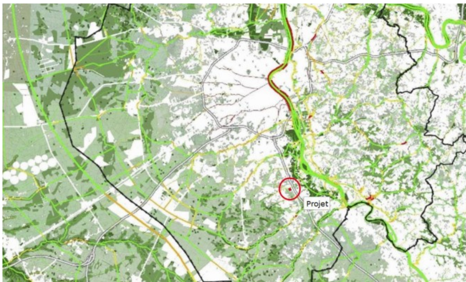
Carte « continuités des espaces sur l'aire métropolitaine de Bordeaux » du SCoT - extrait annexe 4 étude faune flore page 124

Concernant la trame verte et bleue : le site est localisé au nord d'un réservoir de biodiversité « boisements de conifères et milieux associés selon le SRADDET Nouvelle-Aquitaine. Selon le SCoT de l'aire métropolitaine bordelaise, la prairie du projet est identifiée dans les espaces artificialisés, les boisements qui l'entourent sont considérés « comme socle d'espaces naturels, agricoles et forestiers favorables à la nature ordinaire ». Quant au ruisseau du Breyra, il est considéré comme continuité locale sous pression.