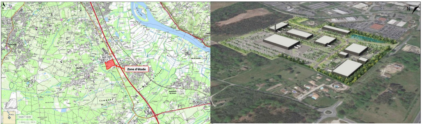
Localisation du projet et vue perspective du projet- extrait étude d'impact pages 17 et 20

Le projet s'insère dans un environnement périurbain (à 700 m du centre-bourg), au contact de l'urbanisation au nord dont il est séparé par le ruisseau le Breyra et de la route départementale RD 1113 qui le longe à l'est. Plusieurs zones industrielles et/ou commerciales se trouvent à proximité du site du projet (deux au nord du site et une autre à environ 200 m à l'est du site). A l'ouest, se trouve un espace naturel et au sud des habitations et des terrains boisés.