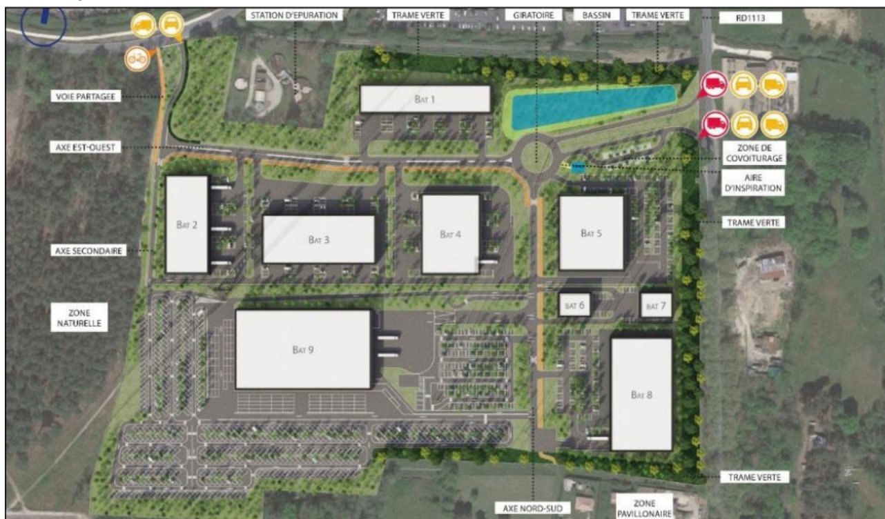
Plan de masse envisagé- extrait étude d'impact page 23

Un plan de masse avec découpage des lots est proposé ci-dessous, reprenant les grands principes d'aménagement de la zone d'activités.