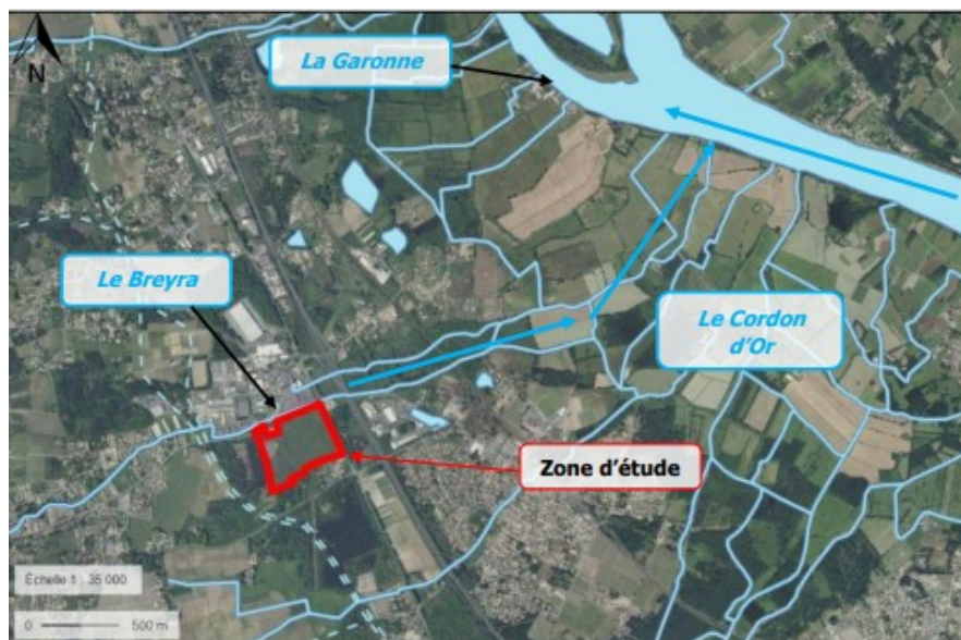
Cartographie du réseau hydrographique – extrait étude d'impact page 49

Le secteur d'étude appartient au bassin versant de la Garonne. Le cours d'eau du Breyra longe le site sur sa partie nord. Le site comprend un réseau de fossés intérieurs au site et sur les contours de l'emprise du projet 2 . L'enclave située à l'extrémité nord-ouest du site du projet est intégrée au dimensionnement du projet pour la gestion des eaux pluviales.