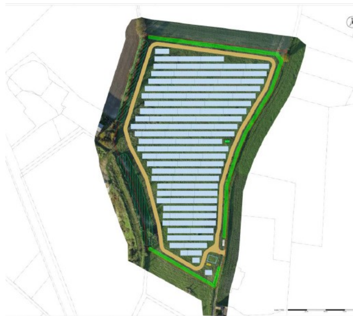
Plan de masse - extrait étude d'impact p. 186

Le projet prévoit un raccordement électrique à Châtellerault (86), à environ 10 km du parc solaire (tracé page 191 de l'étude d'impact). La MRAe rappelle que le raccordement du parc photovoltaïque au réseau public d'électricité fait partie intégrante du projet. Elle recommande que les enjeux environnementaux liés aux opérations de raccordement soient précisés et fassent l'objet de la mise en œuvre de la séquence Éviter Réduire Compenser (ERC). Il en est de même pour les obligations légales de débroussaillage (OLD) imposées au delà du périmètre clôturé du parc.