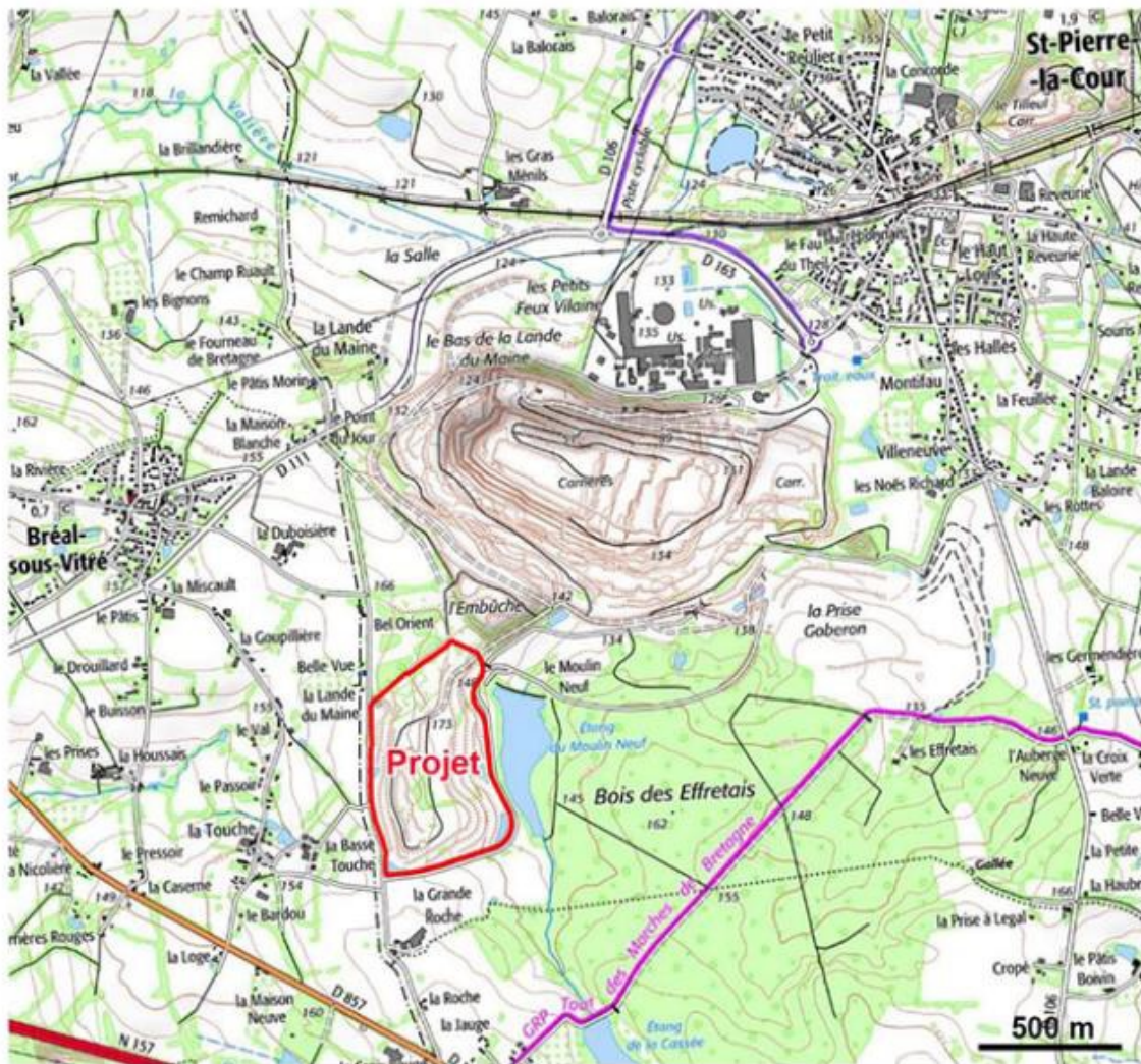
Plans de situation et des abords du projet (extraits de l'étude d'impact – page 17)