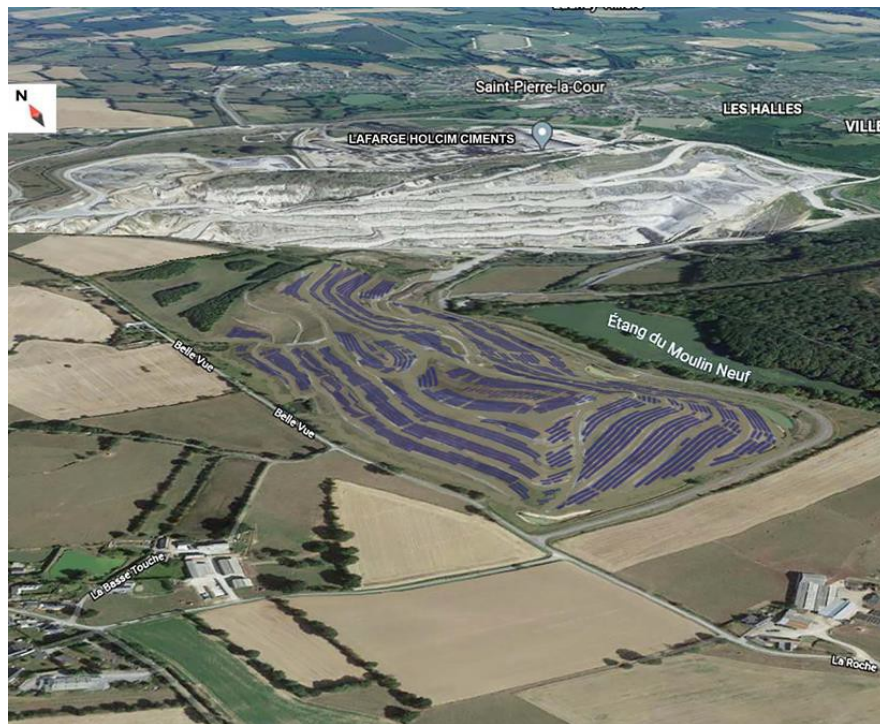
Photomontage d'implantation du projet (extrait du résumé non technique)